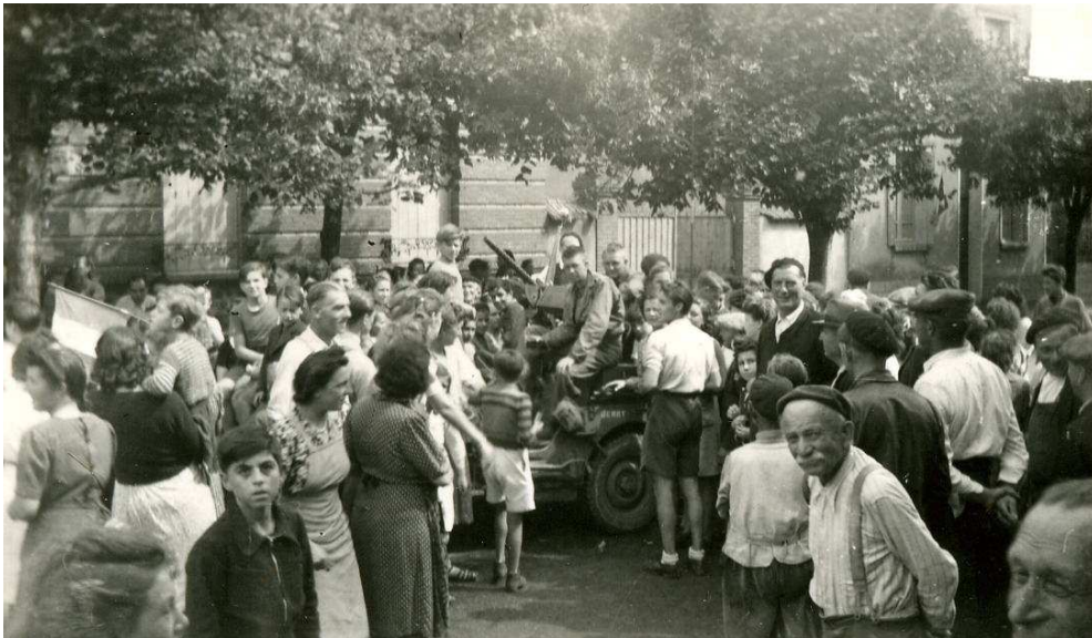
Jeep des alliés devant la gendarmerie de Beaune-la-Rolande. 21 août 1944.