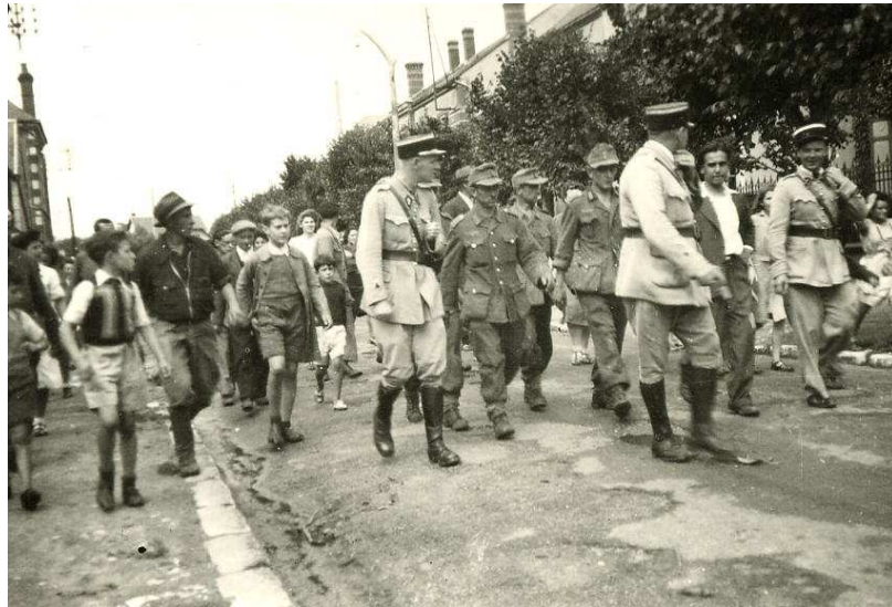
Prisonniers allemands escortés dans Beaune-la-Rolande. 21 août 1944.

PROCLAMATIONS DU COMMANDANT DE LA GARNISON ALLEMANDE DE BEAUNE LA ROLANDE le 18 AOUT 1944 ----- 1er AVIS ----- Par ordre des autorités allemandes, les rassemblements sont interdits. Couvre-feu à 21 heures. Le camouflage des lumières doit être strictement observé; - dans le cas contraire les sentinelles ont l'ordre de tirer. Ce soir, de 20 heures à 21 heures, ceux qui veulent évacuer peuvent quitter la ville; passé ce délai toute entrée ou sortie est interdite. Les portes de toutes les maisons et de tous les garages doivent rester ouvertes aussi bien des maisons occupées que de celles laissées par les personnes quittant la ville. Les fenêtres doivent être fermées. 2ème AVIS ----- LES AUTORITES ALLEMANDES INFORMENT LA POPULATION QU'AU PREMIER ACTE DE SABOTAGE SES OTAGES SERONT PRIS ET FUSILLÉS IMMÉDIATEMENT. 3ème AVIS ----- Les autorités d'occupation informent la population que : 1° il est interdit de circuler à bicyclette. 2° il est interdit d'entrer dans la ville ou d'en sortir. 3° la circulation sur les petits chemins ou sentiers est formellement interdite. 4° quiconque essaiera d'entrer ou de sortir par ces petits chemins ou sentiers sera abattu par les sentinelles 4ème AVIS ----- Les habitants sont informés que s'ils n'ont pas d'abri ils pourront en cas de bombardement trouver refuge dans la crypte de l'église qui peut contenir environ 300 personnes.