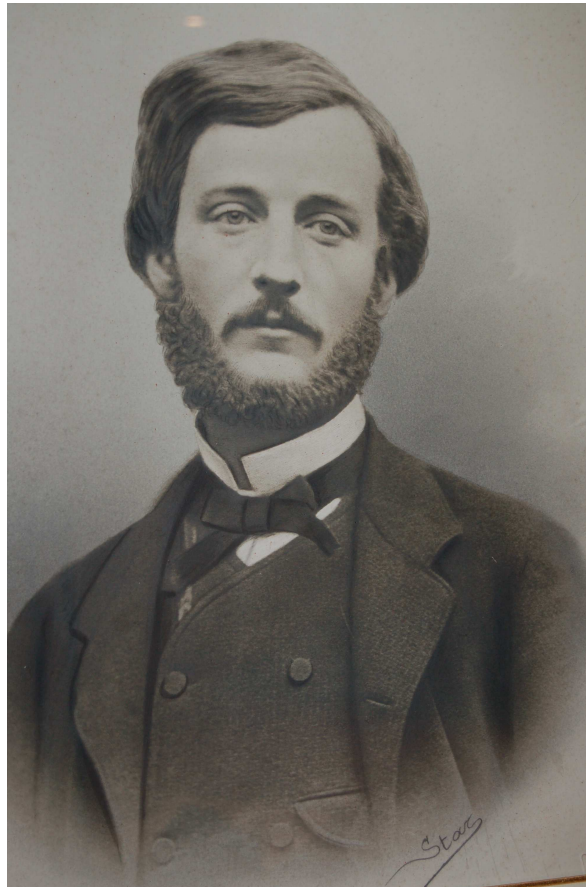
Portrait de Frédéric Bazille. Mairie de Beaune-la-Rolande.

Pour certains d'entre eux, il n'hésitera pas à leur venir en aide financièrement. La gloire n'était pas encore au rendez-vous pour tous ces artistes.